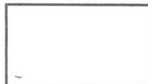
Polegar direito 1